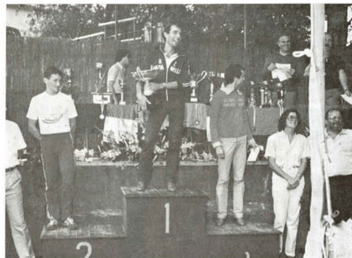
PREMIAZIONE 1982: Cat. SENIORES

Via Carnia, 155 / cancello GENOVA - RIVAROLO